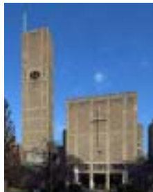
世界平和記念聖堂

大会に先立って、所要で東京へ行った際、どういふ分けか東京駅が見たくて丸の内口へ出たがあいにく改修中でシートに覆われて見ることが出来なかった。2011 年度末に完成するそうですが、ぜひ見てください。