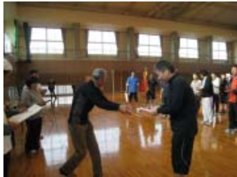
閉会式・結果発表