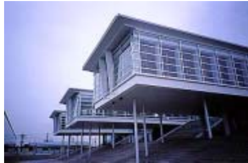
水島サロン / 芦原太郎 + 丹羽英喜