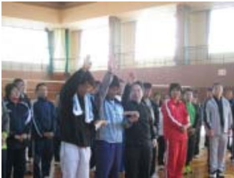
開会式・選手宣誓

新居浜・西条チームの面々とは、初対面の方もいましたが、コミュニケーションをとり楽しく試合ができ良い機会となりました。設計業に携わりデスクワークが多い私は、仕事上それほど体を動かす機会もないので、定期的にこのような活動に参加していきたいと思います。また、より多くの、特に二十代の若い会員に参加して頂きたいと思いました。この様な有益で健全な大会を企画運営された関係者各位の皆様、有難うございました。