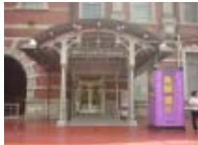
ステーションギャラリーにて真鍋博展（平成 16 年 8 月 21 日撮影）