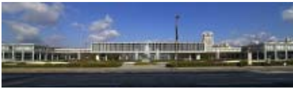
広島平和記念資料館 / 丹下健三