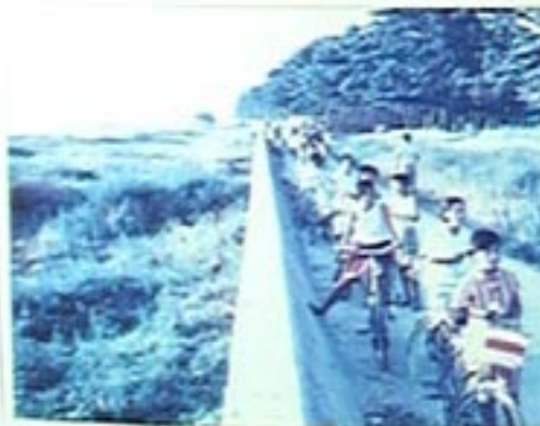
朝のサイクリング